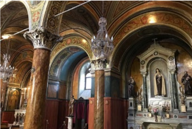
SAİNT POLYCARP KİLİSESİ