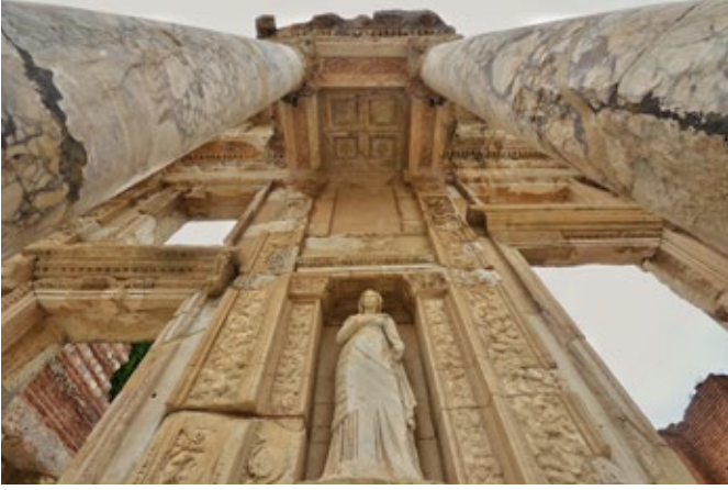
EFES ANTİK KENTİ