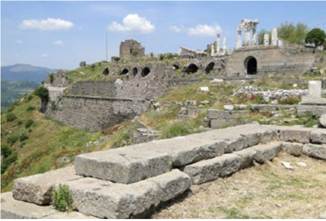
BERGAMA PERGAMON ANTİK KENTİ